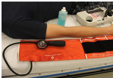
Gambar 6.1 Prosedur