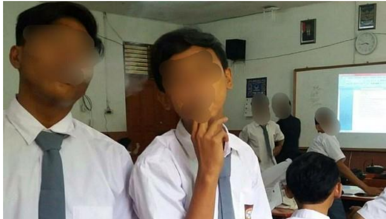
Foto-foto ini memperlihatkan situasi nyata pelajar yang merokok di lingkungan sekolah, baik di dalam kelas maupun saat screening kesehatan. Dokumentasi seperti ini penting sebagai bahan refleksi dan diskusi terkait lemahnya implementasi nilai karakter dan bela negara pada siswa.

Pelaksanaan kegiatan pendidikan karakter di sekolah, mulai dari penguatan nilai-nilai positif, pembelajaran sikap disiplin, hingga implementasi program pembentukan karakter dalam keseharian siswa.