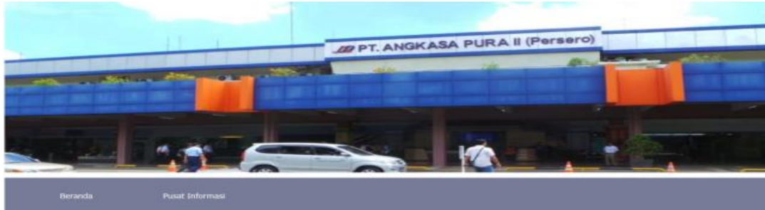
Gambar Tampilan Home page